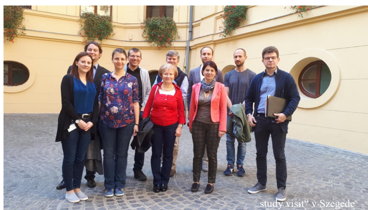
„study visit“ v Szegede

Počas roku 2018 úspešne pokračovali práce na medzinárodnom projekte YOUNIG, zameranom na problematiku migrácie mladých v dunajskom regióne. Na riešení projektu spolupracujú viacerí pracovníci katedry, s INFOSTAT-om a mestskou časťou Bratislava-Rača. Keďže projekt končí v roku 2019, intenzita prác kulminovala. Ich súčasťou bolo prezentovanie výstupov projektu na viacerých konferenciách (Viedeň, Maribor), či vzájomné študijné návštevy a výmeny skúseností s vybranými partnermi (v našom prípade s mestom Szeged). Viaceré aktivity (workshopy, pracovné stretnutia) prebiehali nielen priamo v Rači, ale i na fakulte. K nim patrilo aj „fórum“ venované migrácii a inklúzii (24.10.2018). Mnohé parciálne analýzy, konkrétne aktivity, opatrenia, stratégie sa uvádzajú do praxe či dostávajú do svojich záverečných verzií.