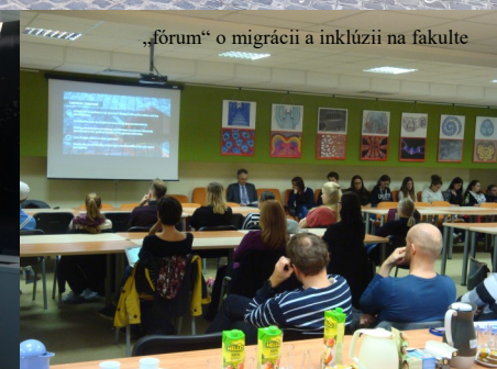
„fórum“ o migrácii a inklúzii na fakulte